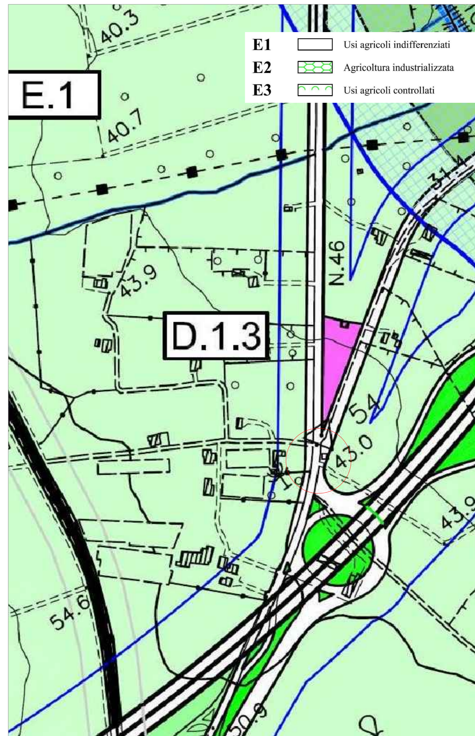
Stralcio del P.R.G.