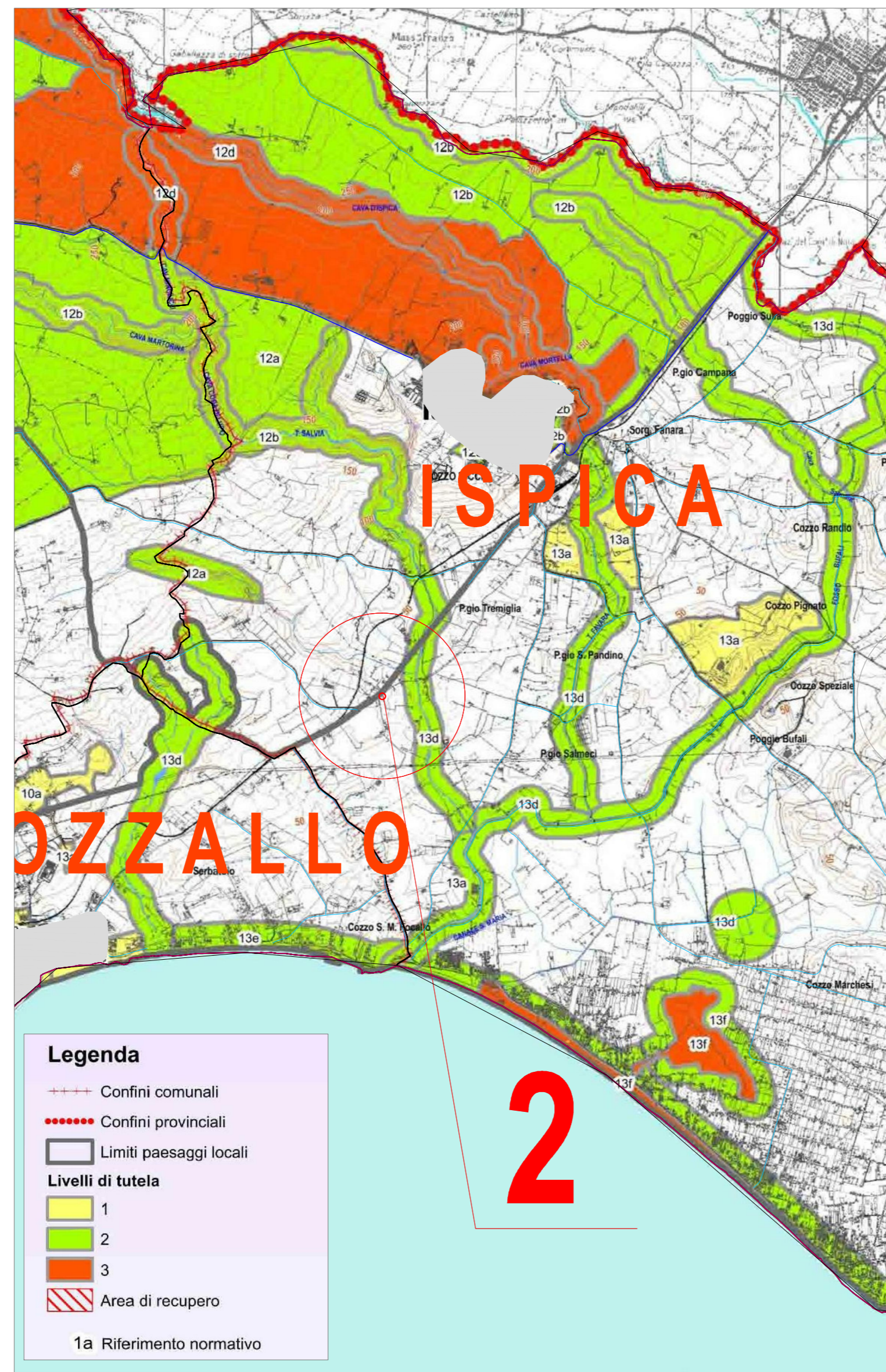
Stralcio del piano paesaggistico della Provincia di Ragusa in scala 1:50.000