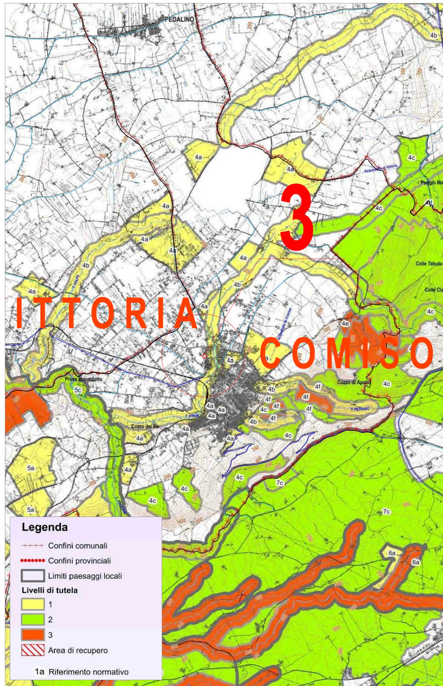
Stralcio del piano paesaggistico della Provincia di Ragusa in scala 1:50.000