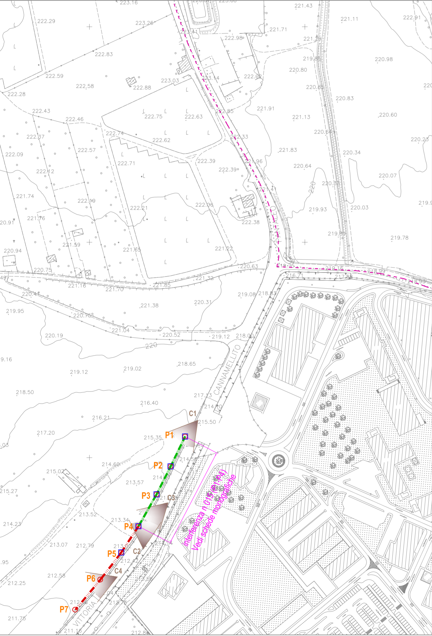
Stato di fatto con indicazione interferenze linea Telecom scala 1:2000

Cn CONO OTTICO FOTO vedi SCHEDE INTERFERENZE