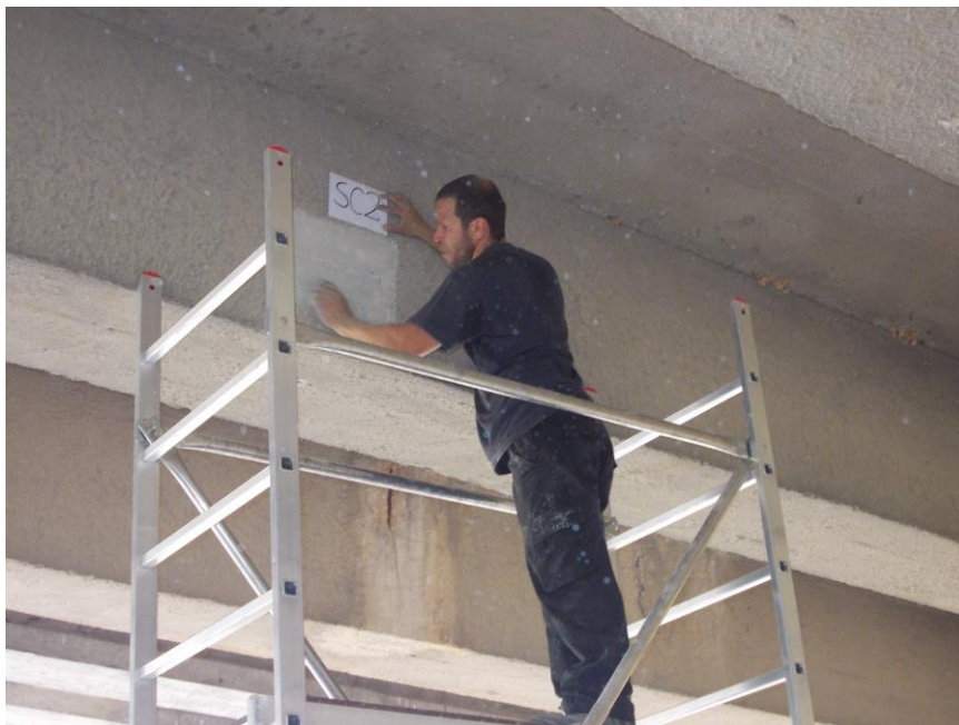
Foto 1: Ponte Salvia – spalla lato Pozzallo - Preparazione della superficie della trave per l'esecuzione delle prove