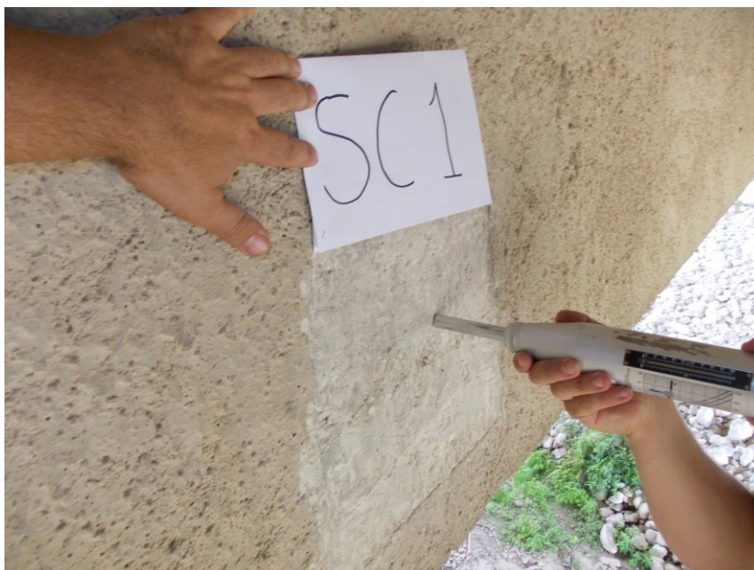
Foto 3: Ponte Salvia – Spalla lato Pozzallo – Esecuzione della prova sclerometrica SC1