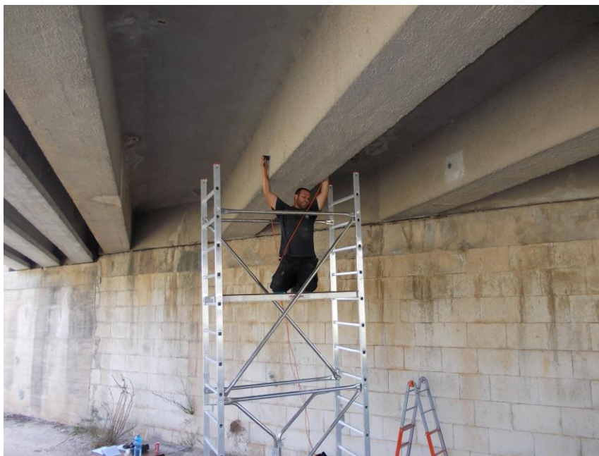
Foto 4: Ponte Salvia – Spalla lato Pozzallo – Esecuzione della prova ultrasonica US2