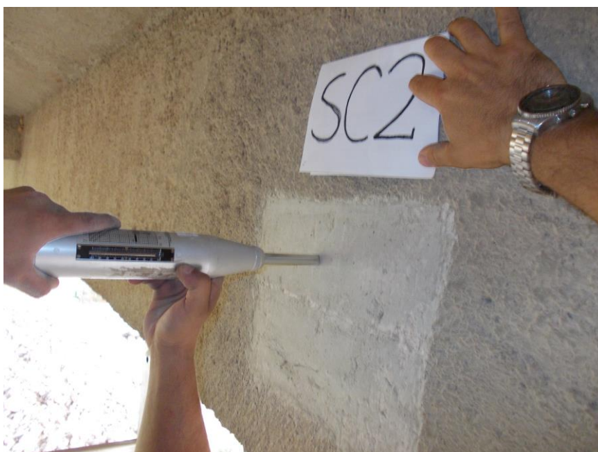
Foto 2: Ponte Salvia – Spalla lato Pozzallo – Esecuzione della prova sclerometrica SC2