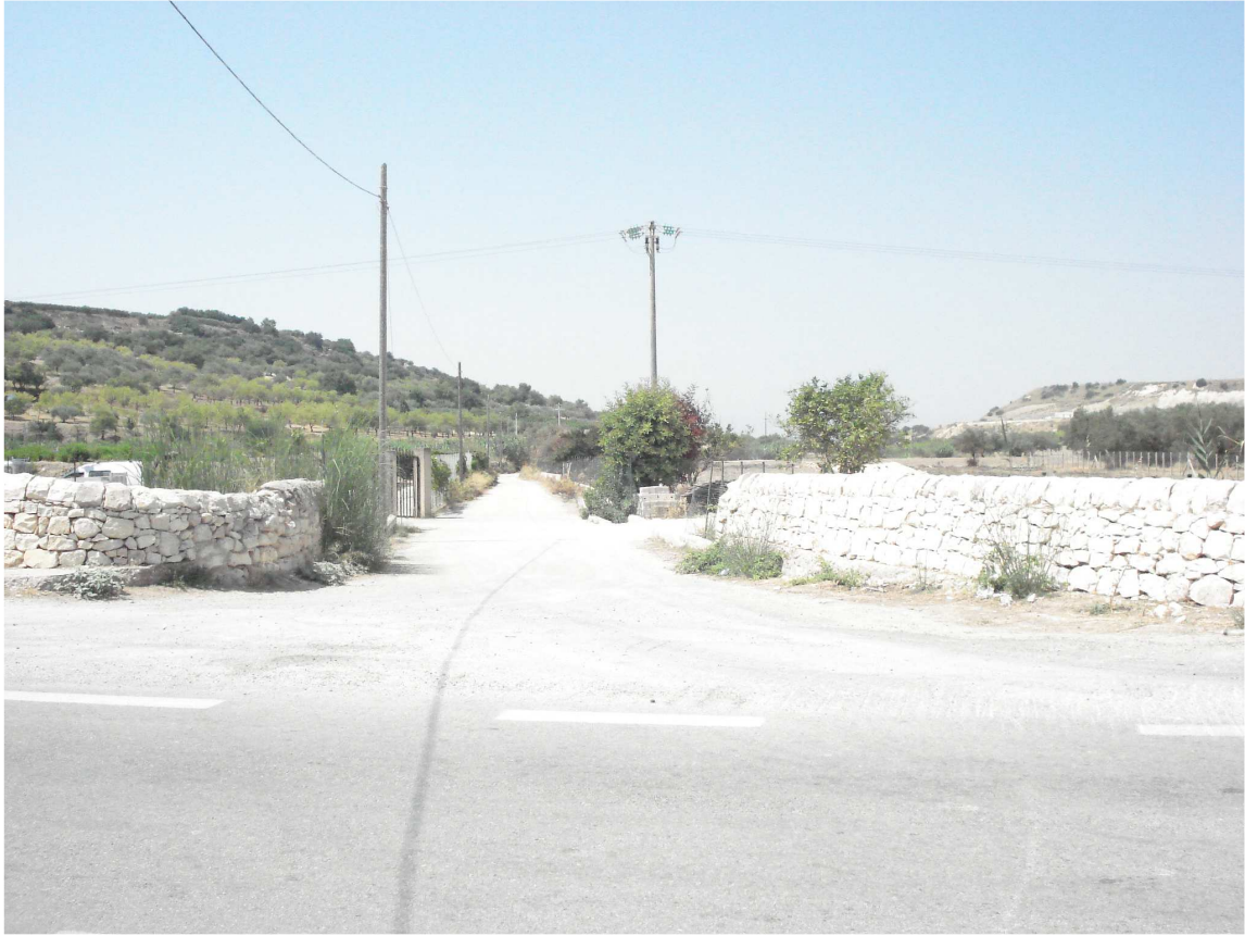
VARCO DX SEZ. 20-21