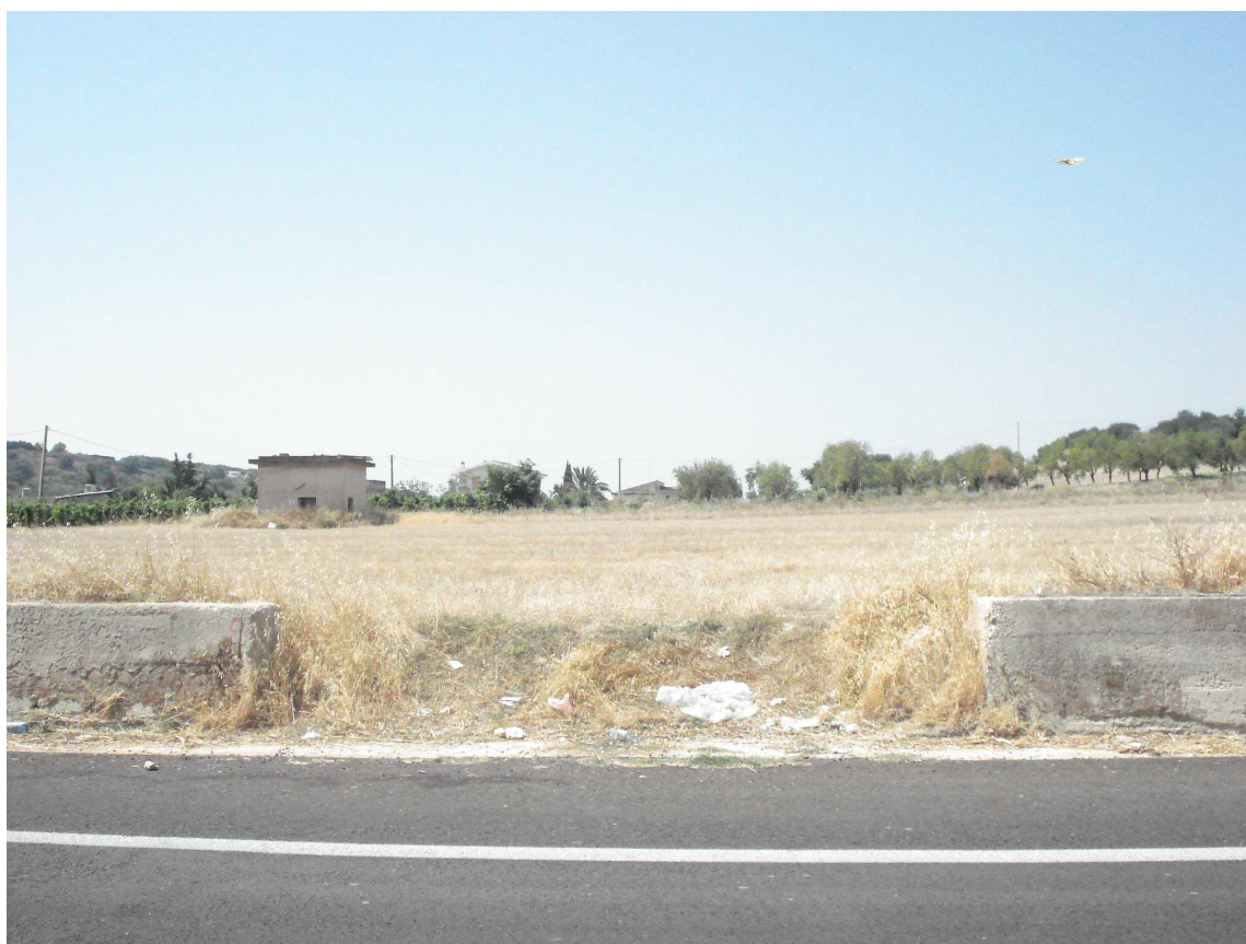
VARCO DX SEZ. 07-08