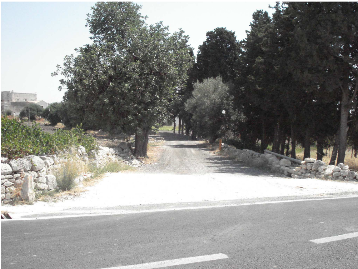
VARCO DX SEZ. 02-03