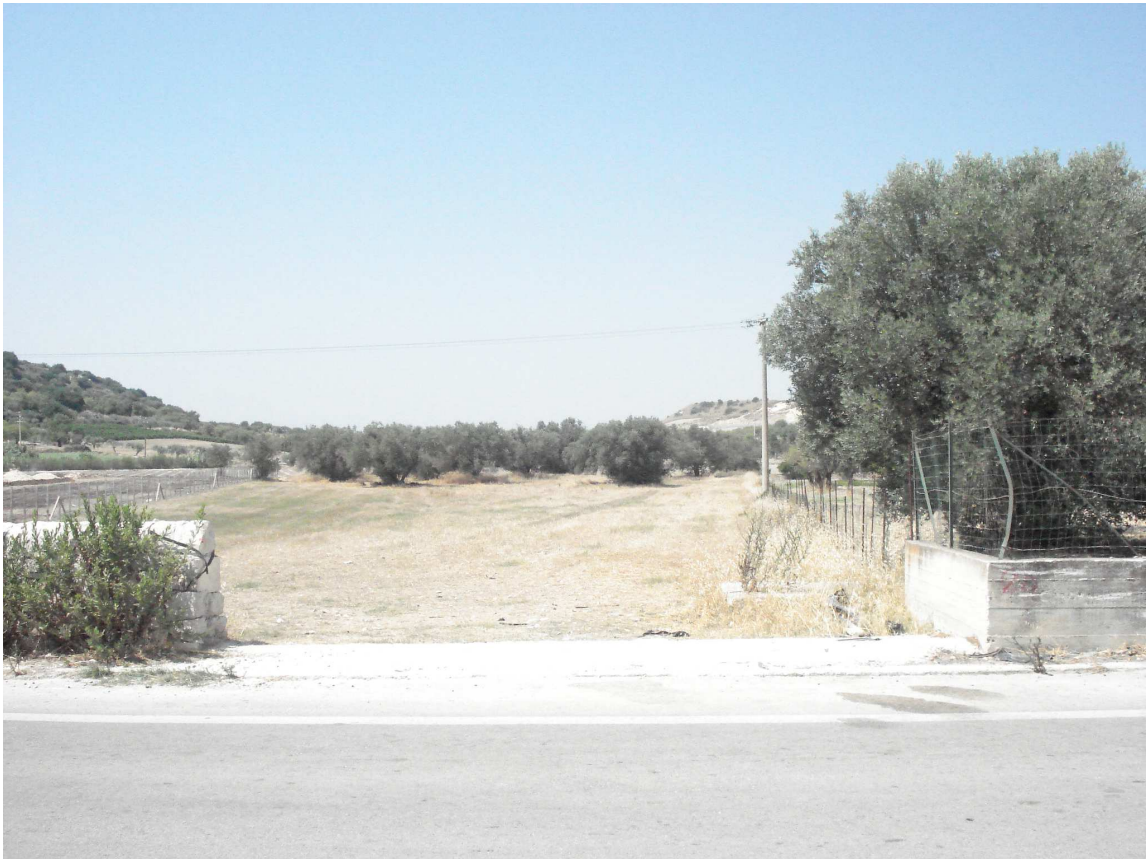
VARCO DX SEZ. 20