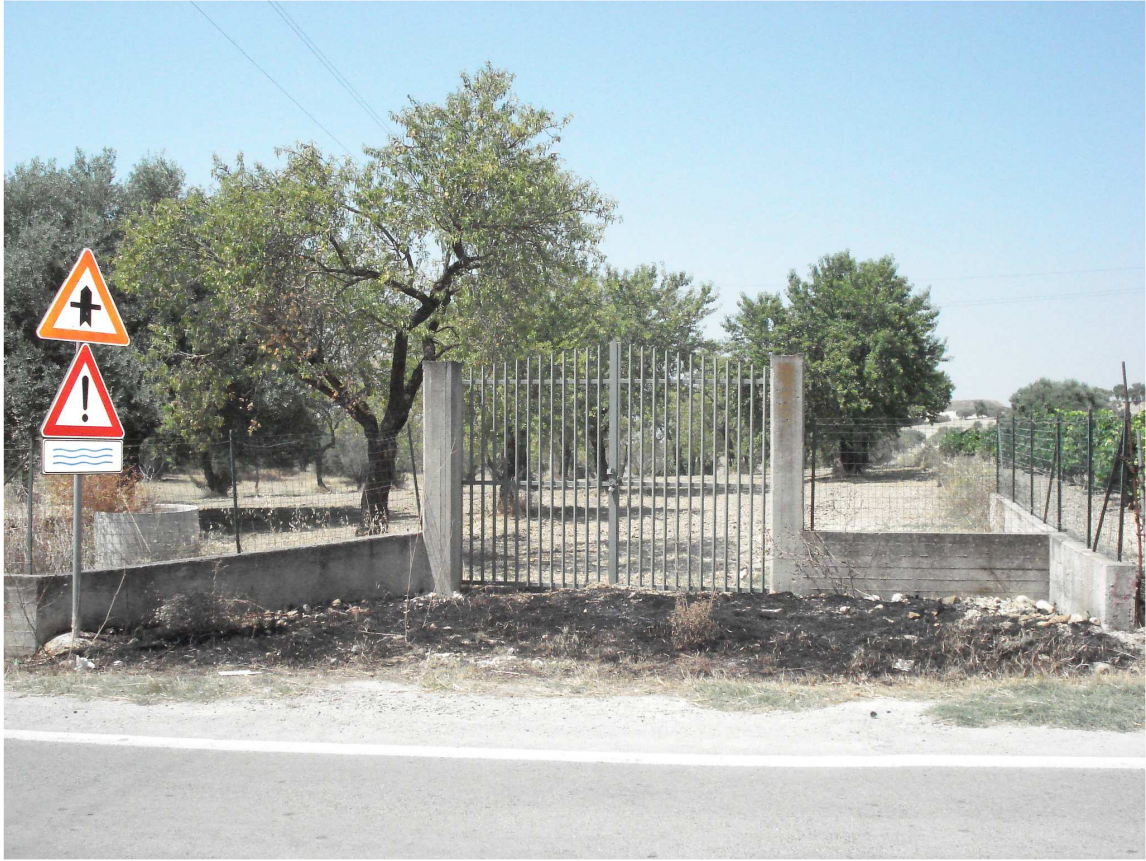
VARCO DX SEZ. 19