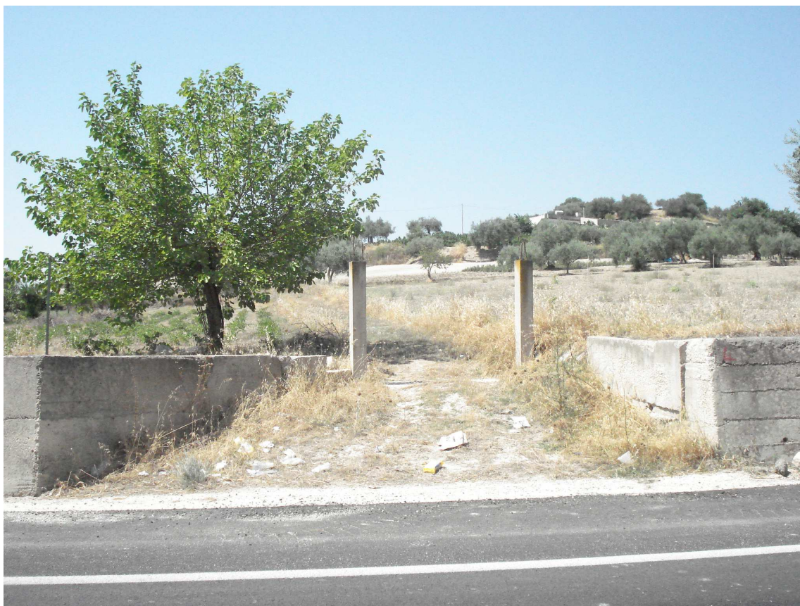
VARCO DX SEZ.04