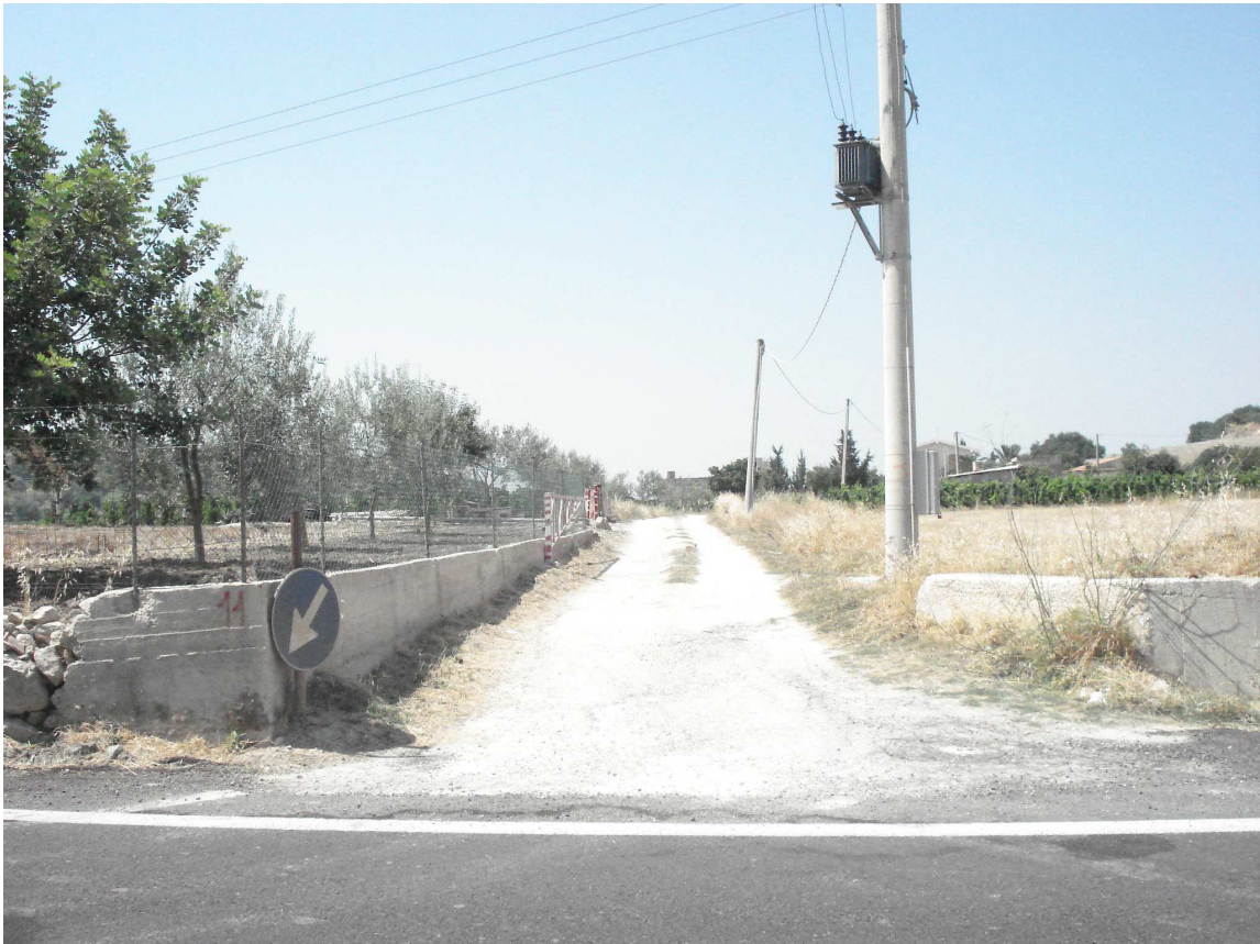
VARCO DX SEZ. 11