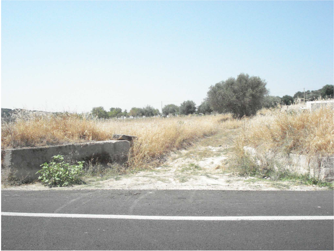
VARCO DX SEZ. 08