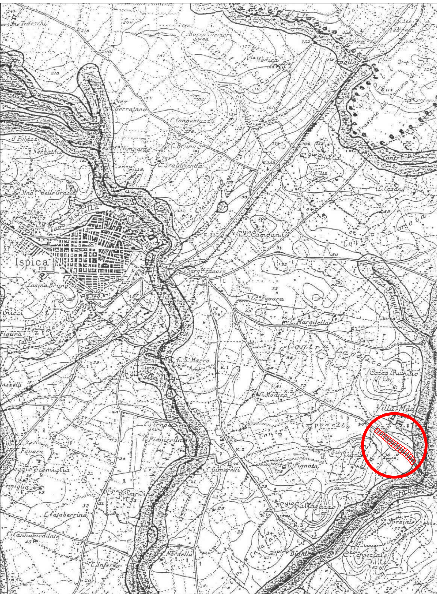
COROGRAFIA E CARTA DEI VINCOLI scala 1/25000