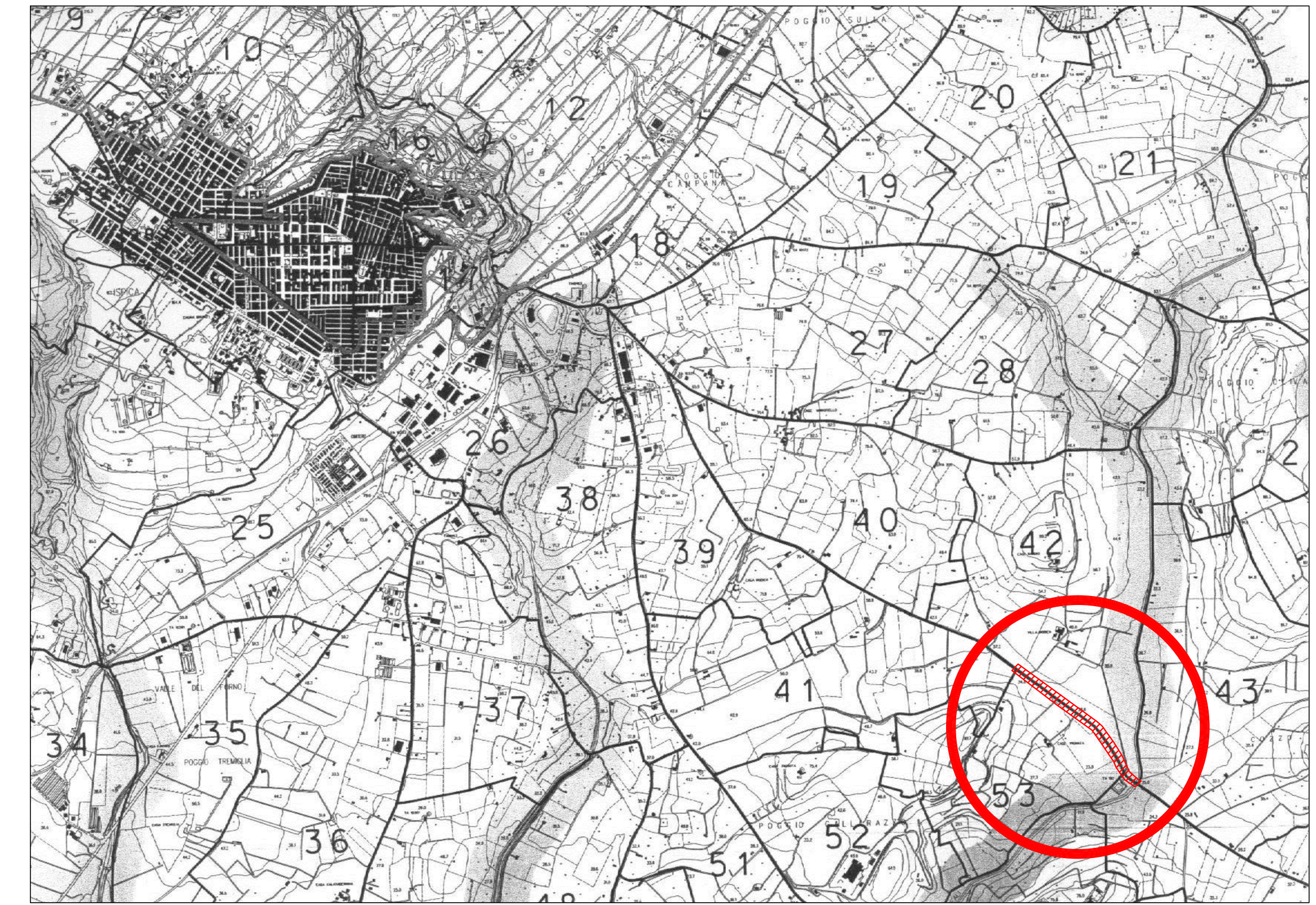
CARTA DEI VINCOLI DI P.R.G. scala 1/20.000 LEGENDA XlpeqyTKlo o qf Hecdkrk'vgo r qtcpgc DA 26/7/2000 Vincolo torrenti e valloni L. 490/99 Tratto S.P. di progetto Ubicazione